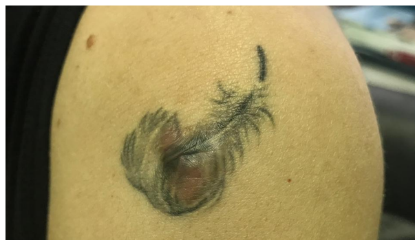
Рис. 1. Декоративная татуировка в виде пера на предплечье левой руки: изменение внешнего вида татуировки, новообразование кожи в области черного пигмента

выростов с тенденцией миграции в дерму. Определялись невусные клетки нескольких типов: в верхних отделах дермы располагались крупные кубовидные клетки с большим содержанием цитоплазмы и наличием пигмента.